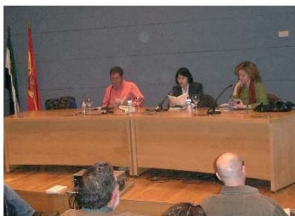
Lectura en el Aula E. Díez-Canedo de Badajoz

Un segundo paso en el proceso de iniciación a la escritura, y una de las iniciativas que con mayor éxito se están desarrollando en Extremadura es la de los Talleres de la Poesía y el Relato . Esta oportunidad para compartir inquietudes, conocer y ensayar -por primera vez en muchos casos- las herramientas imprescindibles de la escritura es uno de los momentos esenciales en esa cadena que da forma a la voluntad de escribir. Los talleres, trece en la actualidad (distribuidos por toda la geografía extremeña más uno virtual) y con un creciente número de alumnos, cuentan con un monitor (un escritor o escritora extremeño) que desarrolla su programa en diez sesiones de índole práctica, en la que se comparten textos y, como es lógico, lecturas, facilitando el tránsito entre una lectura consciente y de calidad y una escritura incipiente. Además, en cada curso los asistentes tienen la oportunidad de mantener encuentros con dos autores invitados, con los que compartir sus experiencias -esa cocina de la escritura- y al final del curso se edita una Antología de los talleres que recoge textos de todos los asistentes, que ven así publicada por primera vez su obra. Los Talleres, fruto de la colaboración entre la Consejería de Cultura, la Asociación de Universidades Populares -donde se realizan- y la Asociación de Escritores Extremeños; han resultado una pieza clave en este sistema de lectura y escritura: muchos asistentes